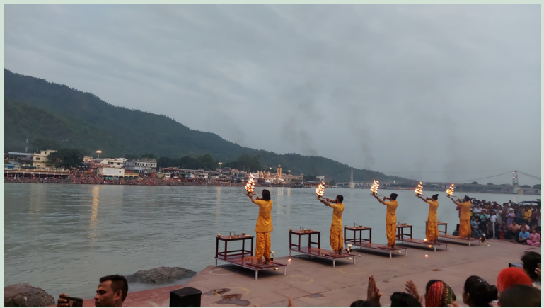
RISHIKESH GANGA AARTI