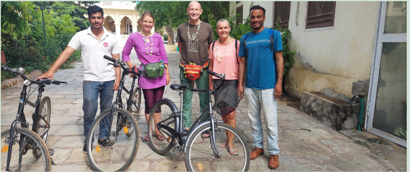
JAIPUR FAHRRAD TOUR