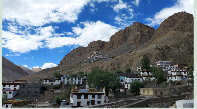
SPITI KEY KLOSTER