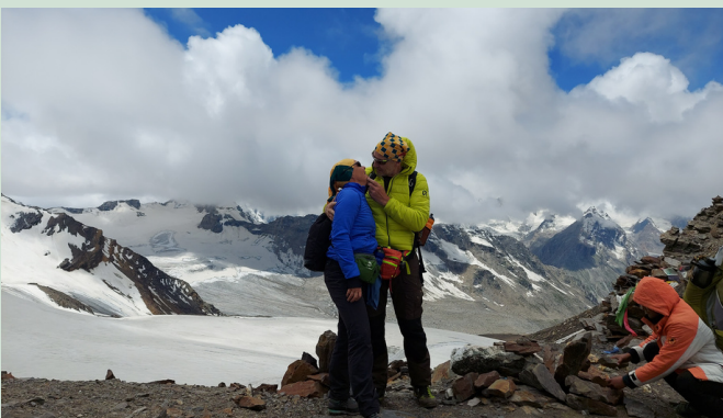
PIN PARVATI PASS TREK