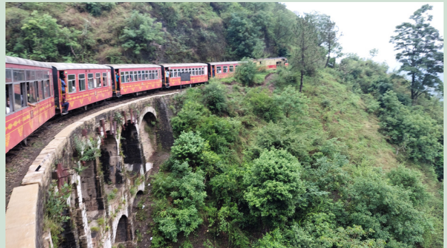
SHIMLA TOY TRAIN