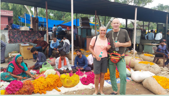
JAIPUR BLUMEN MARKT