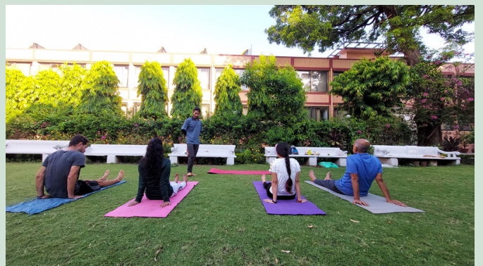
PARMARTH NIKETAN ASHRAM