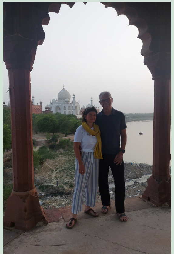
AGRA TAJ MAHAL