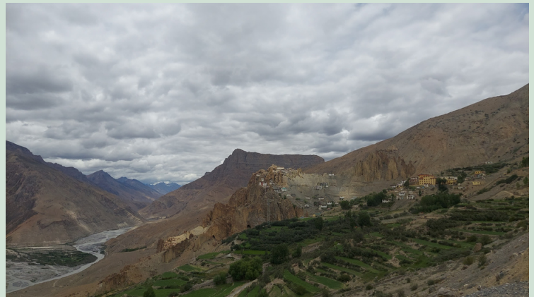
SPITI TAL DHANKAR KLOSTER