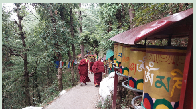
MCLEOD GANJ HIMALAYA