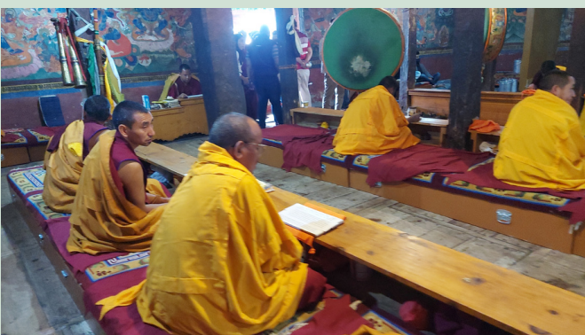
LADAKH THIKSEY KLSOTER