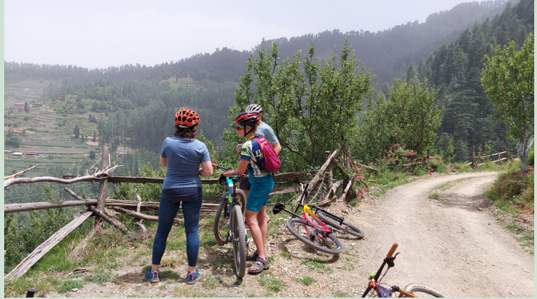
SHIMLA MOUNTAIN BIKE TOUR