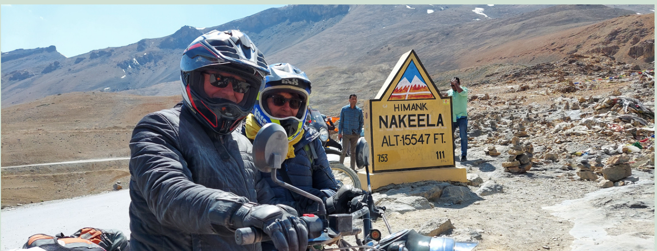
MANALI LEH HIGHWAY MOTORRADREISE