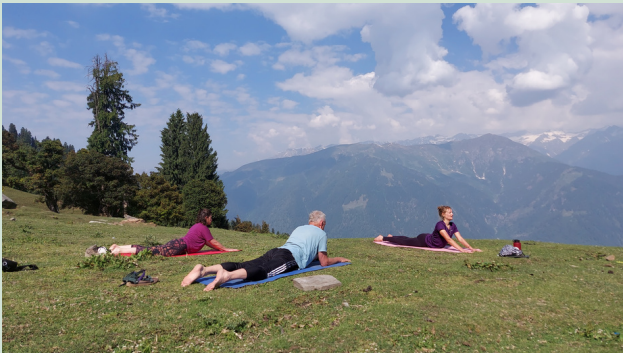
MANALI YOGA TREKKING