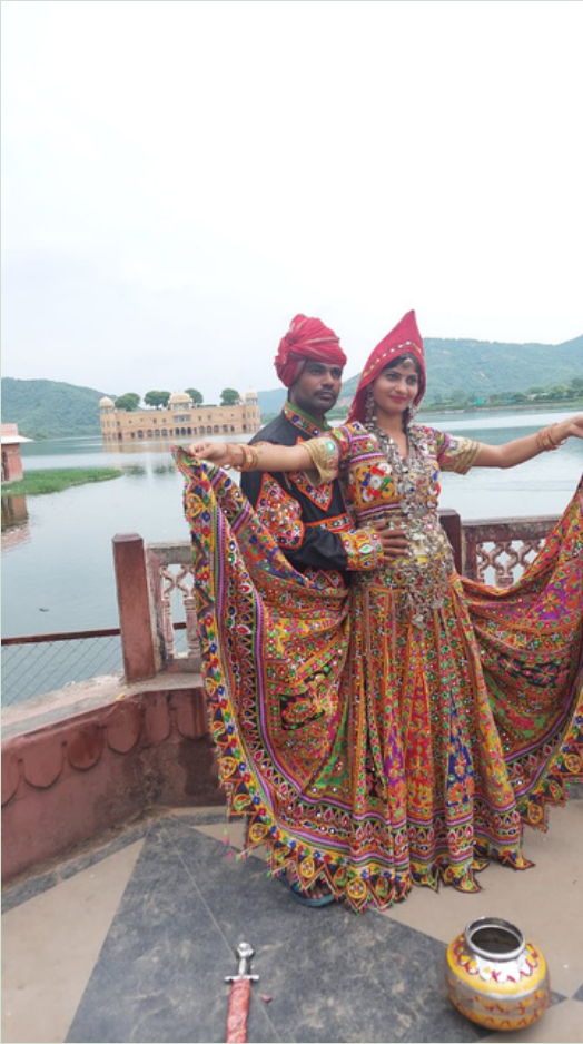
JAIPUR WASSER PALAST