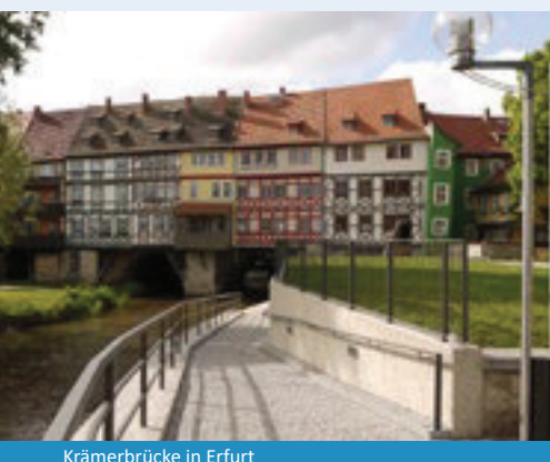
Krämerbrücke in Erfurt

Ihr Radurlaub in der Landeshauptstadt Erfurt hat viel zu bieten! Sie entdecken im Thüringer Becken alte Mauern und schöne Gärten. Entspannt radeln Sie entlang der Flüsse Gera und Unstrut und erkunden die neuen Seenlandschaften. Sie flanieren in Erfurt über die Krämerbrücke, die, mit ihren 120 Metern Länge und 32 Häusern, in Europa einmalig ist. Freuen Sie sich auf reizvolle Ensembles aus reichen Patrizierhäusern und liebevoll rekonstruierten Fachwerkhäusern, die vom monumentalen Mariendom und der Severikirche überragt werden.