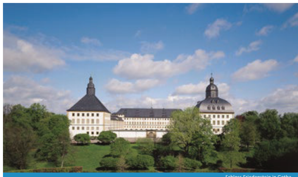
Schloss Friedenstein in Gotha