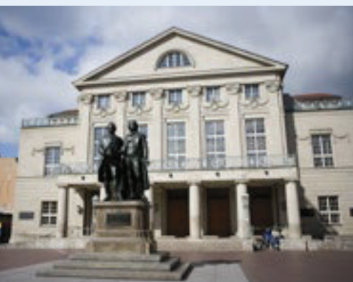
Goethe-Schiller-Denkmal in Weimar

Eine besondere Empfehlung ist die Kombination einer Weimar und einer Erfurt Sterntour. So lernen Sie nicht nur die Landeshauptstadt Thüringens sondern auch die Kulturhauptstadt des Freistaates bestens kennen.