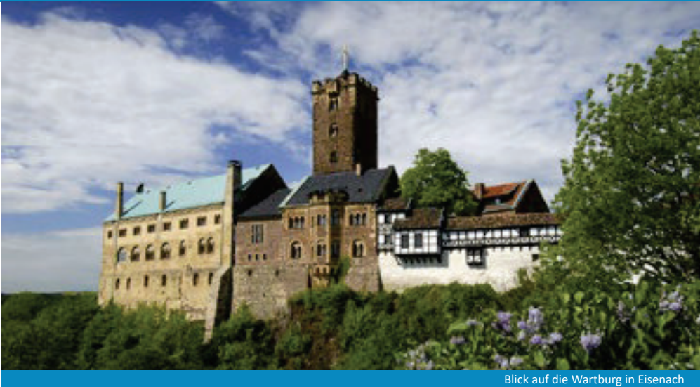
Blick auf die Wartburg in Eisenach