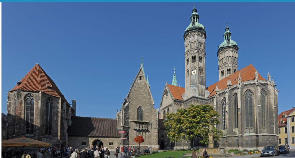
Stern Naumburg Dom mit Domplatz

Das traditionsreiche Weinanbaugebiet Saale-Unstrut liegt am Anfang des romantischen Saale-ales um Naumburg und an den Hängen der Unstrut bei Freyburg. Viele Städte und Orte sind von ihrer Geschichte her interessant, auch deshalb, weil sie traditionelle Weinorte sind.