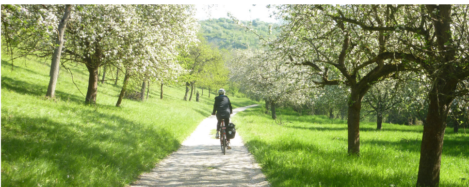
Unstrut Radweg, Radweg nach Nagelstädt

Verlängern Sie diese Reise auch nach Weimar sowie in die Landeshauptstadt Erfurt. So runden Sie Ihr "Thüringen-Erlebnis" ab und lernen die ursprünglichen Orte ebenso kennen wie buntes Treiben und kulturelle Highlights.