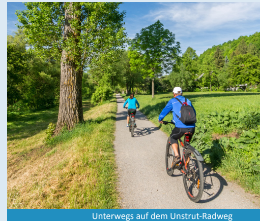
Unterwegs auf dem Unstrut-Radweg

Verlängern Sie Ihre Reise mit einer Übernachtung in der Stadt der Dichter und Denker: in Weimar.