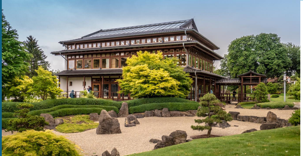
Japanischer Garten Bad Langensalza