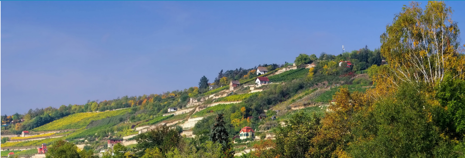
Saale Unstrut Weinberge