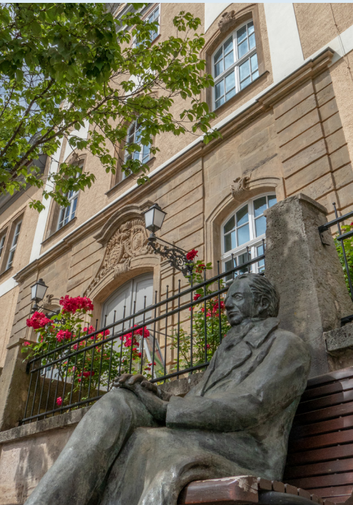
Goethe in Ilmenau

Sie radeln weiter talabwärts, in Fließrichtung der Ilm. Es geht vorbei an Flussauen mit Weiden und Erlen, die von imposanten Kalkwänden umragt werden. Ab und an sammelt sich das Wasser der Ilm in kleinen, idyllischen Seen. Nach einer schönen Fahrt bietet sich eine Mittagstast in Stadtilm an. Vor Ort können Sie sich persönlich überzeugen, warum diese auch den Beinamen die „Stadt der sieben Wunder“ trägt. Sehenswert ist auch der größte Marktplatz Thüringens! Nach etwas Kultur treten Sie wieder kräftig in die Pedalen. Sie erreichen dann die