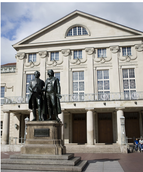
Weimar: Goethe und Schiller mit Theater