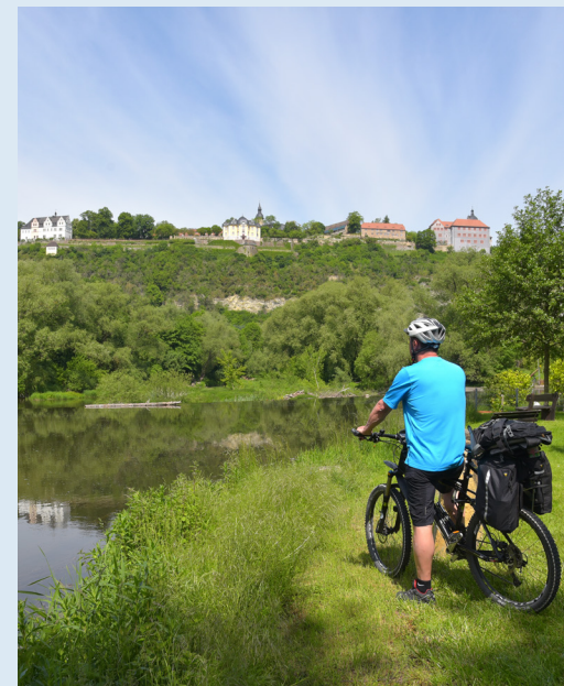
Radfahrer an den Dornburger Schlössern